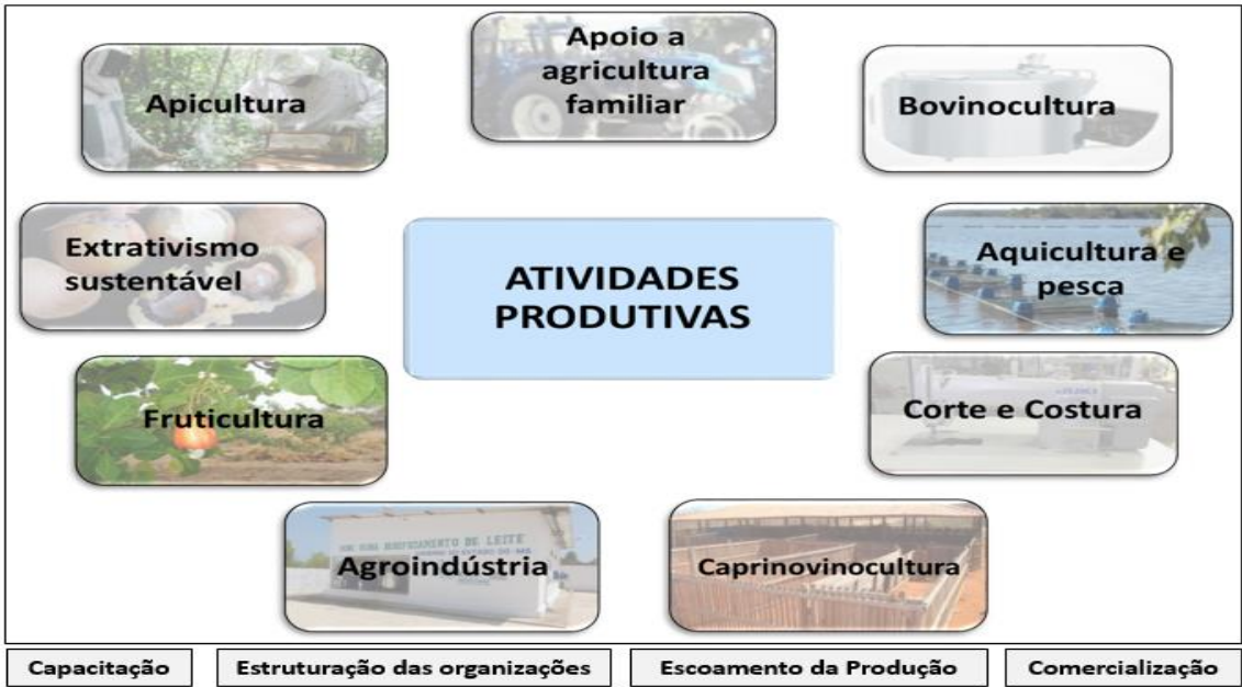
Figura 01: Algumas das atividades produtivas apoiadas pela CODEVASF

O apoio aos Arranjos Produtivos Locais, ocorre de forma continuada ao longo da área da atuação da CODEVASF, por se tratar de ações dinâmicas, tendo em vista que as atividades que visam a produção, sobretudo a de alimentos, estão em constante adequação às demandas de mercado e de necessidade da população regional, nacional e mundial. Neste sentido, a aquisição das casas de farinha e fécula móvel e dos triciclos cargos para fomento à mandiocultura e comercialização dos produtos torna-se essencial para o desenvolvimento da agricultura familiar.